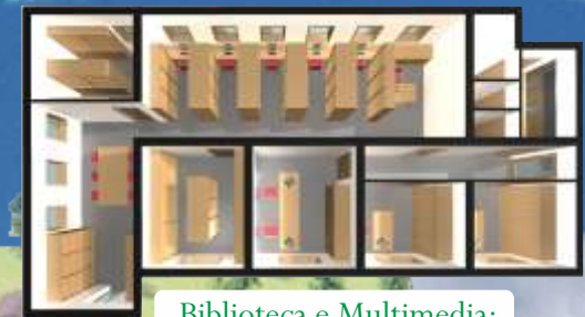
Biblioteca e Multimedia: Il Cuore del Progetto